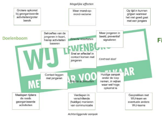
Figuur 1: Probleemboom

bij de huidige situatie, zodat deze personen ook bij het onderzoek betrokken konden worden.