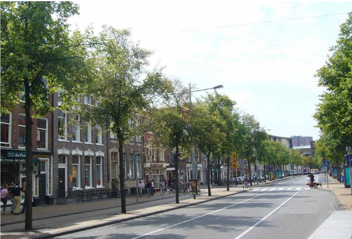
Afbeelding 7: het Gedempt Zuiderdiep in de twintigste eeuw: aangepast aan de menselijke maat

De belangrijkste doelstelling voor de binnenstad was de versterking van de ontmoetingsfunctie. “In het stadscentrum is te allen tijde en voor uiteenlopende mensen en groepen van mensen plaats voor feesten, herdenkingen, manifestaties, demonstraties en akties. Men moet er in de zon kunnen zitten, duiven kunnen voeren, naar de regen kunnen luisteren. Er moeten plekken zijn voor straattoneel, het leger des heils, de kermis, de markt, een postzegelbeurs. Het moet aanleiding geven tot zowel uitbundigheid als bezinning.” (Doelstelling binnenstad Groningen, p. 18). De belevingswaarde van het centrum moest versterkt worden door middel van het behoud van waardevolle stedenbouwkundige structuren, stadsvernieuwing, restauratie van monumenten en beeldbepalende panden en een goede kwaliteit van de openbare ruimte. Het toverwoord bij dit alles is ‘de menselijke schaal’, oftewel kleinschaligheid. Een goed voorbeeld is het Gedempt Zuiderdiep, dat opnieuw werd ingericht (zie Afbeelding 7).