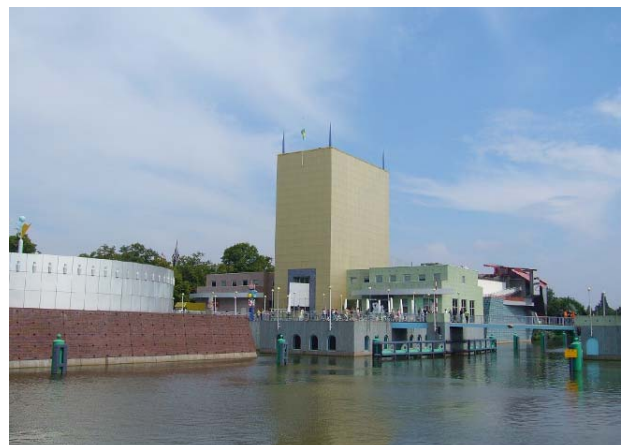
Afbeelding 33: twee museumgebouwen met een leeftijdsverschil van 100 jaar