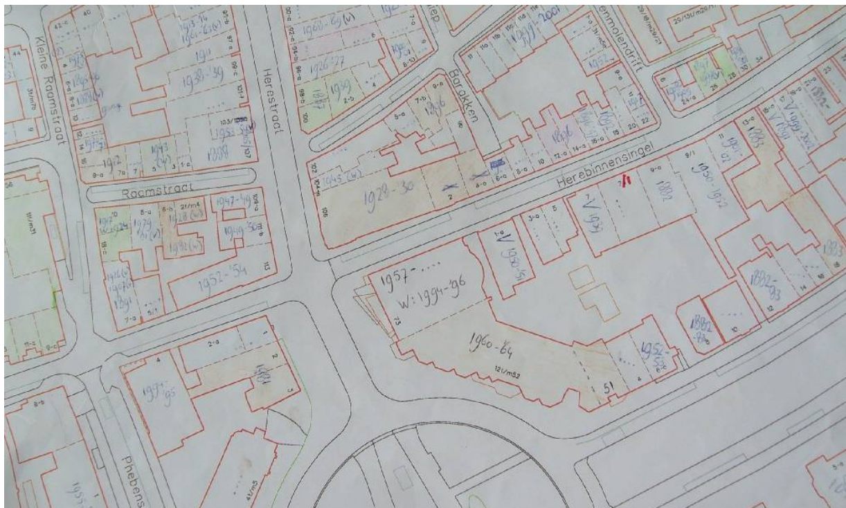
Afbeelding 2: een deel van de kadastrale kaart van 2003 (met eigen aantekeningen)

Op de kadastrale kaart van 2003 staan allemaal vlakjes (zie Afbeelding 2). In principe staat elk vlakje voor een zelfstandige ruimtelijke eenheid met een eigen voordeur en een eigen functie oftewel: een onderzoekseenheid.