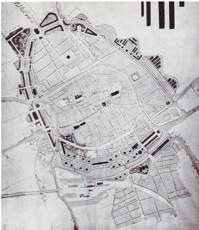
Afbeelding 11: Plan van aanleg en uitbreiding van B. Brouwer, 1878

verhogen, werd de Haagse architect B. Brouwer uitgenodigd om een gedetailleerde stedenbouwkundige invulling te maken van het globale plan van Van Gendt (Ligtenberg en Smook, 1992) (zie Afbeelding 11). Aan de zuidrand van de stad werd een chique representatieve woonruimte gecreëerd, met villa's en veel groen, om de beter gesitueerden aan de stad te binden (zie Afbeelding 10). Een 'schoon' plan van uitleg voor de zuidrand van de stad was tevens belangrijk, omdat dit het 'gezicht' van Groningen was (Ligtenberg en Smook, 1992, p. 38-39). Brouwer had in 1878 het gedetailleerde plan van uitleg gereed, dat ondanks een afwijzing door het Rijk, toch grotendeels werd uitgevoerd