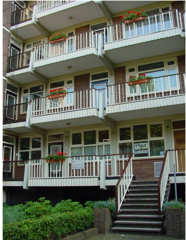
Afbeelding 22: de kantoren op de begane grond van de Heeredwingerflat

In de periode van de wederopbouw is op de plaatsen waar de bestaande bebouwing kapot was geschoten, opvallend vaak een gebouw neergezet, met op de begane grond kantoren en op de verdieping(en) wonen. Dit paste in de tijdgeest van de wederopbouw: ruimte voor ondernemers op een efficiënte manier gecombineerd met wonen, alhoewel de grote opleving van het wonen in de binnenstad nog moest beginnen. Een voorbeeld hiervan is de Heeredwingerflat (Ubbo Emmiusingel 4 t/m 36, zie Afbeelding 22), gebouwd in 1952 met op de begane grond een aantal kantoren en op de verdiepingen een kleine twintig woonappartementen.