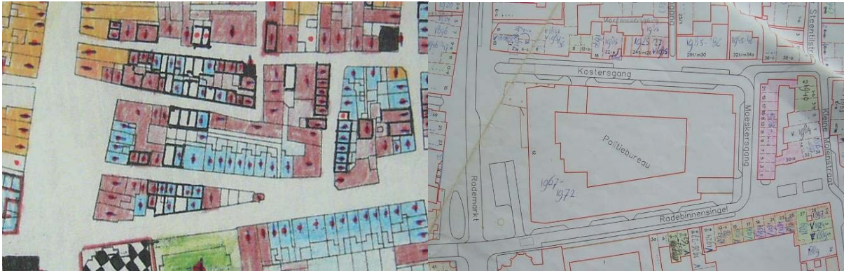
Afbeelding 14: (links) de drie bouwblokken uit 1961 die (rechts) onder het politiebureau verdwenen zijn

andere plekken schaalvergroting plaats. Zo werden voor de bouw van het politiebureau aan de Rademarkt drie historische bouwblokken met veelal slechte woningen en bedrijfspanden weggesaneerd ten gunste van grootschalige stedelijke voorzieningen (zie Afbeelding 14).