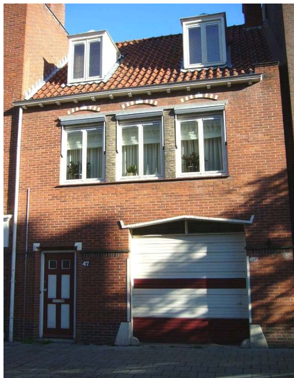
Afbeelding 3: 'wonen'

Wel is lang getwijfeld welke functie toe te kennen aan panden die een garagedeur beneden hadden en dan de woning erboven (zie Afbeelding 3). Moest dit 'opslag' of 'wonen' worden? De garage was duidelijk voor het parkeren van de eigen auto en fietsen e.d. Als het een buitenwijk zou betreffen, zou deze zich gewoon naast het huis op het eigen terrein bevinden en zou de hoofdfunctie van de begane grond 'wonen' zijn. Om deze reden is ervoor gekozen om deze panden het predikaat 'wonen' te geven.