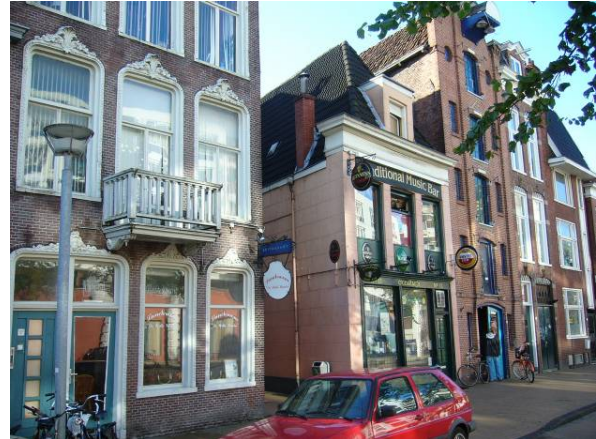
Afbeelding 32: Uitgaansgelegenheden aan het Gedempt Kattendiep, in oude panden en in nieuwe gebouwen.

Omdat cultuur steeds belangrijker werd in het onderscheid tussen steden, werd ook een aantal grote uitgaansgelegenheden, zoals theaters, bioscopen en orkesten in de (binnen)steden gestimuleerd. In het onderzochte gebied is in 1996 een grote bioscoop aan het Gedempt Zuiderdiep gebouwd, op een plek die vrijkwam doordat de brandweerkazerne naar een plaats buiten de binnenstad is verhuisd.