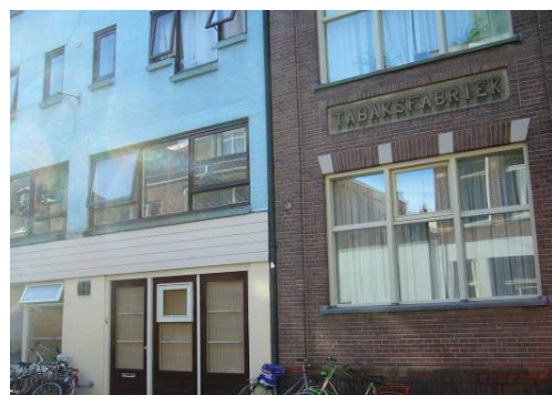
Afbeelding 18: Tabaksfabriek verbouwd tot wooneenheden voor studenten

Uit Tabel 10 blijkt dat een opvallend hoog percentage onderzoekseenheden (18,8 %, dit komt overeen met 78 onderzoekseenheden) met een woonfunctie in 2005, in 1961 een bedrijfsfunctie had. Deze onderzoekseenheden bevinden zich verspreid over het onderzochte gebied, maar niet in de winkelstraten Herestraat en Steentilstraat. Het waren vaak pakhuizen, zoals Coehoornsingel 55 t/m 59, of fabrieken en groothandels, bijvoorbeeld de Tabaksfabriek Lief tinck aan de Raamstraat (zie Afbeelding 18) en de