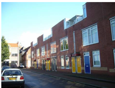
Afbeelding 16: De Moeskersgang in 1915 en in 2005