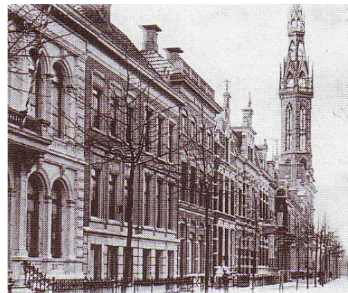
Afbeelding 10: Luxe woonhuizen aan de Heresingel in 1899

In de periode van de ontmanteling werden het Zuiderdiep en het Kattendiep gedempt. Tegelijkertijd werd het Verbindingskanaal gegraven, als verbinding tussen het pas voltooide Eemskanaal en het Noord-Willemskanaal, met in het midden een zwaaiком voor de schepen. Tevens werd de zuidoostelijke hoek van de vestinggracht omgevormd tot de Oosterhaven. Het Verbindingskanaal vormt de zuidgrens van het onderzoeksgebied.