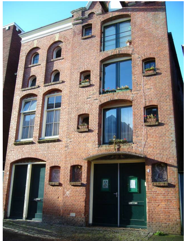
Afbeelding 38: de Russisch-Orthodoxe kerk in een voormalig pakhuis aan de Ganzevoort-singel

De ontkerkelijking van de afgelopen decennia heeft ervoor gezorgd dat veel kerkgebouwen verhuurd werden voor niet-kerkelijke activiteiten. Zo kregen de kerken geld binnen om de onderhoudskosten van het gebouw te kunnen betalen, want de kerkgemeenten waren steeds kleiner geworden. Dit betekent dat de kerkgebouwen niet alleen een godsdienstige functie vervullen, maar ook een functie als podium voor culturele uitingen. In één geval heeft een gemeente een kerkgebouw helemaal afgestoten, waardoor het een andere functie heeft gekregen, namelijk woningen.