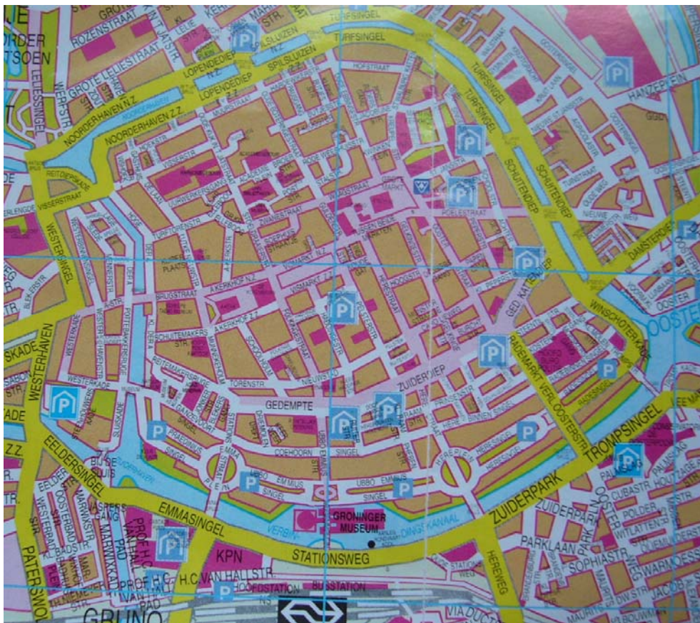
Afbeelding 9: de binnenstad van Groningen

Het deel van de stad Groningen waar dit onderzoek heeft plaatsgevonden, is het zuidelijke deel van de binnenstad 13 . De binnenstad van Groningen is het gebied dat door de diepenring wordt ingesloten (met ander woorden: door grachten wordt omringd) 14 . Op de huidige plattegrond van de binnenstad (zie Error! Reference source not found. ) wordt het onderzochte gebied in het noorden begrensd door de Reitemarkersrijge, het Gedempt Zuiderdiep en het Gedempt Kattendiep, in het oosten door het Schuitendiep en de Winschoterkade, in het zuiden door het Verbindingskanaal en in het westen door de Zuiderhaven.