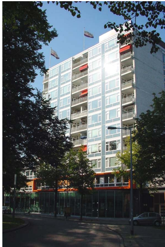
Afbeelding 5: Hereplein, jaren '60 hoogbouw

In de jaren vijftig en zestig groeide de welvaart en de economie. Dit werd weerspiegeld in het gemeentelijke ruimtelijke ordeningsbeleid, dat gericht op een 'moderne' presentatie, stedelijke grootschaligheid en vernieuwing door reconstructie. De hoogbouw aan het Hereplein is hier een goed voorbeeld van (zie Afbeelding 5). In het structuurplan van 1961 ging men uit van 265.000 inwoners in de gemeente Groningen in het jaar 2000. In het ontwerpstructuurplan van 1969 werd op deze optimistische visie voortgeborduurd. Tot nu toe waren de geplande stadsuitbreidingen concentrisch, met de Grote Markt als (toegankelijk) middelpunt. In het ontwerp-structuurplan van 1969 werd hier van afgeweken, met de invoering van de 'gebundelde deconcentratie'. Hierin gaat de gemeentelijke overheid uit van de 'sectorenstad': de concentrische uitbreidingen werden gespleten door middel van groene scheggen en de voorzieningen werden gelijkmatig over de stadsdelen verspreid. De