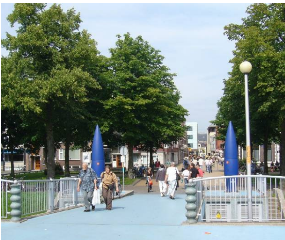
Afbeelding 13: de Ubbo Emmiusstraat is tegenwoordig erg druk met voetgangers en fietsers