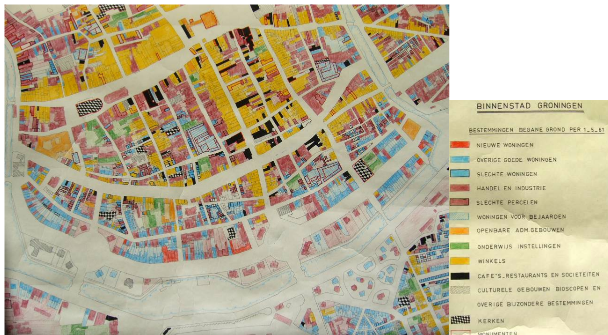
Afbeelding 4: een deel van de kaart van 1961 (met legenda)

1961. Of ze functioneel bij elkaar hoorden is afgeleid uit andere bronnen, vooral uit het Adresboek 1961, maar soms ook uit historische boeken of uit de bouwdoSSIERS in de archieven.