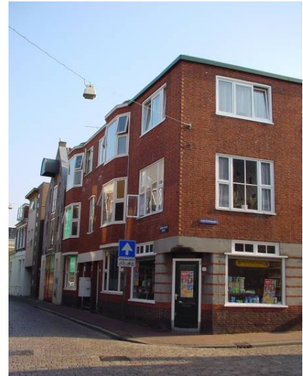
Afbeelding 27: een winkel op de hoek Kosterstang/ Kleine Molenstraat (sinds 1940)

De ‘winkel op de hoek’ 20 is in de ‘oude’ noordelijke deel van het onderzochte gebied nog vaag te herkennen, zie bijvoorbeeld Radebinnensingel 38, hoek Kleine Molenstraat, waar in 1898 een winkelpand (met benedenwoning) en stalling werd gebouwd. Ook het pand dat in 1900 op de plek van de huidige Zuiderkuipen, hoek Ganzevoortsingel stond, bevatte een winkel (en een benedenwoning). Uit het feit dat beide panden naast een winkel ook nog een benedenwoning op de begane grond omvatten, bleek wel dat de winkels nog vrij kleinschalig waren. Dit zou later wel veranderen. In 1961 bijvoorbeeld werd de gehele begane grond van Radebinnensingel 38 door de winkelfunctie in beslag genomen. Ook in het ‘nieuwe’ zuidelijke deel van het onderzochte gebied is de ‘winkel op de hoek’ terug te vinden, bijvoorbeeld op de twee zuidelijke hoeken van de Radesingel.