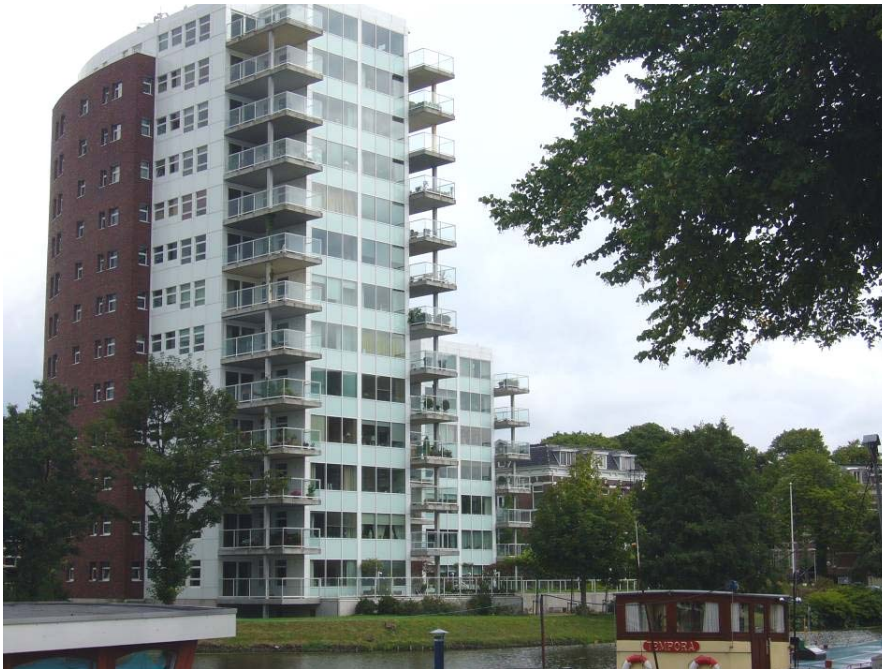
Afbeelding 15: luxe appartementen aan de Praediniussingel (gebouwd in 1996)

De jaren negentig brachten nieuwe ideeën over bouwen in de stad. Er werden duurere woonhuizen gebouwd, omdat daar behoefte aan bleek te zijn. De architectuur werd meer opvallend, omdat een opvallend gebouw bij kon dragen aan het beeld van de stad als geheel. Hét voorbeeld is natuurlijk het Groninger Museum, maar er zijn nog andere voorbeelden. De flatgebouwen aan de zuidzijde van de Praediniussingel zijn opvallend vormgegeven en bevatten appartementen in de hogere prijsklasse (zie Afbeelding 15). Ook de woningen aan de Prinsenstraat zijn van moderne architectuur en wat ruimer en duurder dan de woningen die in de tijd van de stadsvernieuwing werden gebouwd. Zie bijlage 5 voor een foto-impressie van het onderzochte gebied.