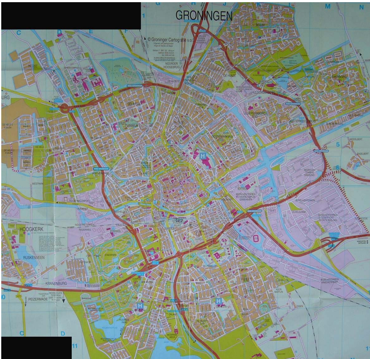
Afbeelding 8: de stad Groningen in 2005

Het proces van uitbreiding heeft zich vooral na de Tweede Wereldoorlog versneld voorgedaan, waardoor uitgestrekte nieuwe woonbuurten zijn verrezen (zie Afbeelding 8). Hierdoor werd de positie van de binnenstad als spin in het web verder versterkt. Tegenwoordig is Groningen een belangrijk stedelijk centrum in het noorden van Nederland. Veel van de belangrijke stedelijke en regionale voorzieningen bevinden zich in de stad, zoals bijvoorbeeld het Provinciehuis, de Rechtbank, de Rijksuniversiteit en twee grote ziekenhuizen, waarvan één academisch ziekenhuis.