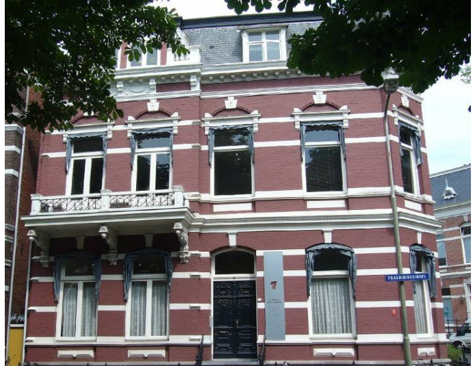
Afbeelding 24: een representatief kantoorpand aan de Praediniussingel

In 2005 zijn er nog steeds tand- en huisartsen aan de singels te vinden, maar ook fysiotherapeuten en psychotherapeuten. Veel werken tegenwoordig samen in groepspraktijken, zodat de gehele benedenverdieping hiervoor in gebruik genomen is. De advocaten-, notaris- en accountantskantoren zijn ook nog steeds aan de singels te vinden (zie Afbeelding 24). Voor zulke kantoren is uitstraling van een pand vaak belangrijk, en daarom zijn de oude villa's zeer geschikt. Dit maakt ze ook meteen 'vindbaar' voor hun cliënten, omdat algemeen bekend is dat dit type kantoren