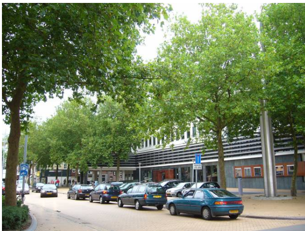
Afbeelding 36: het Hoofdbureau van Politie aan de Rademarkt

De overheid heeft van oudsher een plek in de binnenstad. Het stadhuis en de rechtbank bijvoorbeeld, die zich veelal in statige, historische panden op een zeer centrale plek bevonden. In de loop van de 20 e eeuw waren de taken van de overheid sterk uitgebreid, en hiermee ook het aantal gebouwen dat zij nodig had om haar taken uit te voeren. In het onderzochte gebied waren rond 1900 nog geen overheidsgebouwen gevestigd, die nu nog steeds bestaan, maar daar kwam snel verandering in. Zo werd in 1928 het gebouw van de Dienst Gemeentewerken voltooid. De ‘gemeentewerken’ waren echter al sinds 1861 op deze locatie gevestigd (Hofman, 1997). Door toename van bouwregelgeving en uitbreiding van de stad, had deze dienst steeds meer ruimte nodig, vandaar de nieuwbouw in 1928. Op de kaart van 1961 is dit gebouw te zien, met nog drie andere overheidsgebouwen, waaronder het Bijkantoor der Post in de Steentilstraat en het Arbeidsbureau in de Stationsstraat.