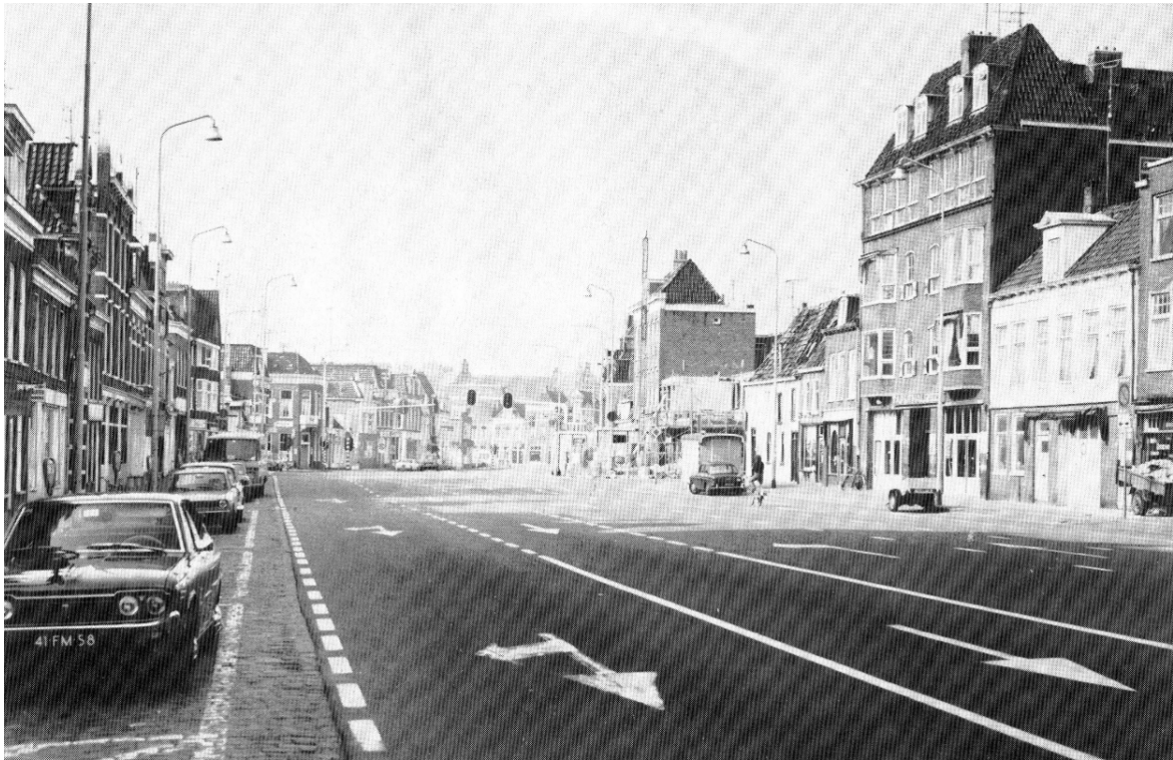
Afbeelding 6: het Gedempt Zuiderdiep in de jaren '60: ruim baan voor het verkeer

economie en de bereikbaarheid van de binnenstad voor verkeer stonden hierin centraal. Zo wordt het Gedempt Zuiderdiep geheel geasfalteerd, om ruim baan aan het verkeer te geven (zie Afbeelding 6).