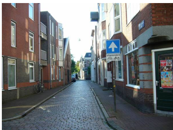
Afbeelding 25: de Kleine Molenstraat, erg smal

In het oostelijke deel van het onderzochte gebied heeft de bedrijfsfunctie zich beter kunnen handhaven, vermoedelijk omdat dit deel meer doorgaande straten kent, met veel publiekstreckende functies, zoals winkels en horeca. Uitzondering zijn de Herebinnensingel en het gebied rond de Kleine Steentilstraat en de Kleine Molenstraat. Waarschijnlijk was de moeilijke toegankelijkheid en parkeergelegenheid van deze smalle straten een push-factor voor de bedrijven die hier gevestigd waren (zie Afbeelding 25).