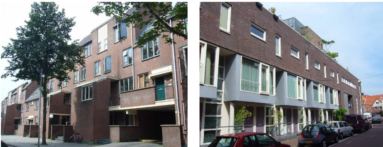
Afbeelding 17: links: ‘stadsvernieuwing’, rechts: ‘stedelijke vernieuwing’

De stedelijke vernieuwing 17 is terug te vinden in de Prinsenstraat. De in de jaren negentig gebouwde woningen zijn veel groter, luxer en duurder dan de woningen in het complex aan de Herepoortenmolendrift (zie Afbeelding 17 Afbeelding 17, rechts). Deze woningen zijn duidelijk voor een andere doelgroep bestemd en passen daarmee goed in het beleid om geschikte woonmogelijkheden te creëren voor mensen met een hoger inkomen. De oude bewoners moesten elders in de stad een plekje zoeken. Een ander voorbeeld van stedelijke vernieuwing zijn de twee luxe woontorens aan de Praediniussingel (zie hoofdstuk 5, Afbeelding 15). De nieuwbouw in de Prinsenstraat is voor een klein deel gebouwd door een woningbouwvereniging, de rest van de Prinsenstraat en de woontorens aan de Praediniussingel zijn door een projectontwikkelaar tot stand gekomen.