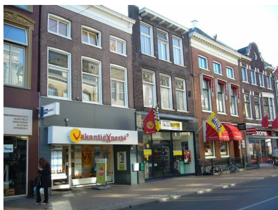
Afbeelding 26: een reisbureau in de Herestraat

De omgekeerde beweging, panden die van een woon- naar een bedrijfsfunctie gingen, heeft ook plaatsgevonden, maar dan in veel minder sterke mate (23 panden). Dit gebeurde vooral in de oostelijke singels (inclusief de Ubbo Emmiussingel). Dit komt voort uit het feit dat deze panden te duur voor bewoning geworden waren, gecombineerd met het in de voorgaande alinea omschreven effect dat de bedrijfsfunctie zich in oostelijke helft van het onderzochte gebied beter heeft kunnen handhaven.