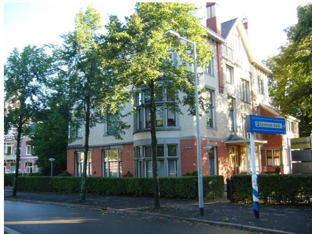
Afbeelding 21: Emmaplein 6, het eerste pand met uitsluitend kantoorlokalen op de begane grond

In 1900 was er nog geen enkele onderzoekseenheid in het onderzochte gebied te vinden dat uitsluitend de functie 'kantoor' had. Het kantoor kwam wel voor als onderdeel van een andere functie. Zo staat in de bouwvergunning voor Radesingel 27 in 1900 bijvoorbeeld te lezen 'een gebouw, bevattende magazijnen en kantoren en eene bovenwoning voor den magazijnmeester'. Het eerste pand dat nieuw gebouwd werd met uitsluitend kantoorlokalen op de benedenverdieping, was Emmaplein 6, in 1904-'05 (zie Afbeelding 21). De bouw was aangevraagd door de Algemene Groninger