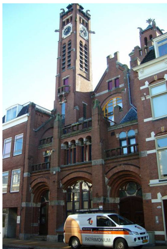
Afbeelding 19: de Zuiderkerk, nu verbouwd tot woonruimtes

Een voorbeeld van een verandering van functie anders dan bedrijven in 1961 naar de functie 'wonen' in 2005 is de Zuiderkerk aan de Stationsstraat. Deze kerk had in 1961 nog een religieuze functie, maar het werd in 1984/85 door woningstichting "Patrimonium" verbouwd tot 21 HAT-eenheden en 4 woningen (zie Afbeelding 19). Door afname van de gemiddelde huishoudengrootte was er behoefte aan kleine wooneenheden voor een- en tweepersoonshuishoudens. Door het compacte-stad-beleid werd intensief ruimtegebruik gestimuleerd en daarmee deze vorm van hergebruik van grote en vaak karakteristieke panden.