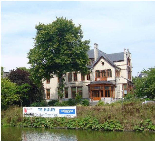
Afbeelding 23: te huur: Huize Tavenier

wen zijn, zullen de energiekosten hoger zijn en de inrichtingsmogelijkheden minder flexibel. Ook is de bereikbaarheid per auto en de parkeermogelijkheid beperkt. Bovendien zijn in de stad Groningen veel kantoorparken verrezen, die wel aan de moderne eisen voldoen. En omdat het aanbod de vraag overtreft, hebben kantoren de keuze.