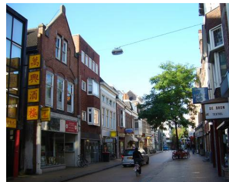
Afbeelding 31: de Steentilstraat geeft een gevarieerd beeld: winkels, horeca en andere bedrijvigheid

Tabel 17 laat zien dat 75 % van de onderzoekseenheden die in 1961 een winkelfunctie had, deze in 2005 nog steeds had. Qua winkellocaties hebben zich dan ook geen grote verschuivingen voorgedaan. Wat wel veranderd is, is de afname van het aantal onderzoekseenheden met een winkelfunctie in 2005, ten gunste van vooral bedrijven, horeca en wonen. Onderzoekseenheden die in 1961 de functie ‘winkel’ hadden, en in 2005 de functie ‘bedrijven’ zijn vooral te vinden in de Herestraat, de Rademarkt en het Gedempt Zuiderdiep. De Steentilstraat (zie Afbeelding 31) hoort hier ook bij, maar in deze straat is zijn tevens veel onderzoekseenheden met de omgekeerde functieverandering (van bedrijf naar winkel) te vinden. De onderzoekseenheden die veranderd zijn van ‘winkel’ in 1961 naar ‘horeca’ in 2005 zijn vooral aan de Steentilstraat, de Rademarkt en het Gedempt Zuiderdiep te vinden. Uit deze ontwikkelingen blijkt duidelijk dat de winkelstraten uit 1961 in 2005 een meer gevarieerd beeld laten zien. Onderzoekseenheden die in 1961 een winkelfunctie hadden en in 2005 een woonfunctie, zijn vooral te vinden aan een straat die een ‘woonstraat’ geworden is: de Ganzevoortsingel en aan het westelijke deel van het Gedempt Zuiderdiep. Ook een aantal ‘winkels op de hoek’ zijn woonhuis geworden.