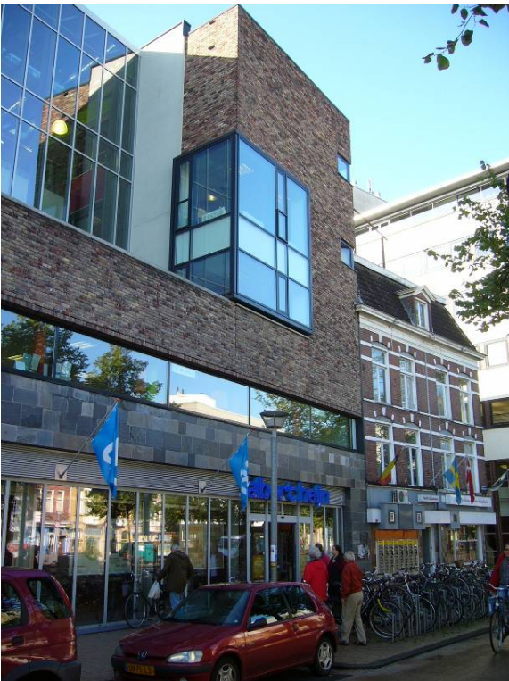
Afbeelding 30: een nieuwe supermarkt aan de zuidoostzijde van het Gedempt Zuiderdiep

In 2005 is het beeld in de winkelstraten in vergelijking met 1961 behoorlijk veranderd (vergelijk ook de kaarten van deze jaren in bijlage 4). Het aantal winkels is afgenomen (zie Tabel 15 en Tabel 17), en andere functies hebben een plek in de winkelstraten gevonden. Dit zijn vooral de horeca en de zakelijke dienstverlening, zoals uitzendburo's en makelaars. Ook staan er panden leeg, vooral in de Herestraat en de Steentilstraat (zie Afbeelding 29, punt C). Deze panden worden, op een enkele uitzondering na, wel weer vrij snel door een nieuwe winkel ingevuld. Wel bijzonder is de komst van een supermarkt aan het Gedempt Zuiderdiep (zie Afbeelding 30). Blijkbaar is door de toename van de binnenstadsbevolking en de toegenomen financiële draagkracht daarvan, de komst van een nieuwe supermarkt gerechtvaardigd. Bij de winkel bevindt zich een parkeergarage, zodat ook binnenstadsbezoekers eenvoudig in deze winkel hun boodschappen kunnen doen. Ook staan er een flink aantal bushaltes voor de deur, waardoor ook mensen die gebruik maken van het openbaar vervoer gemakkelijk van deze supermarkt gebruik kunnen maken.