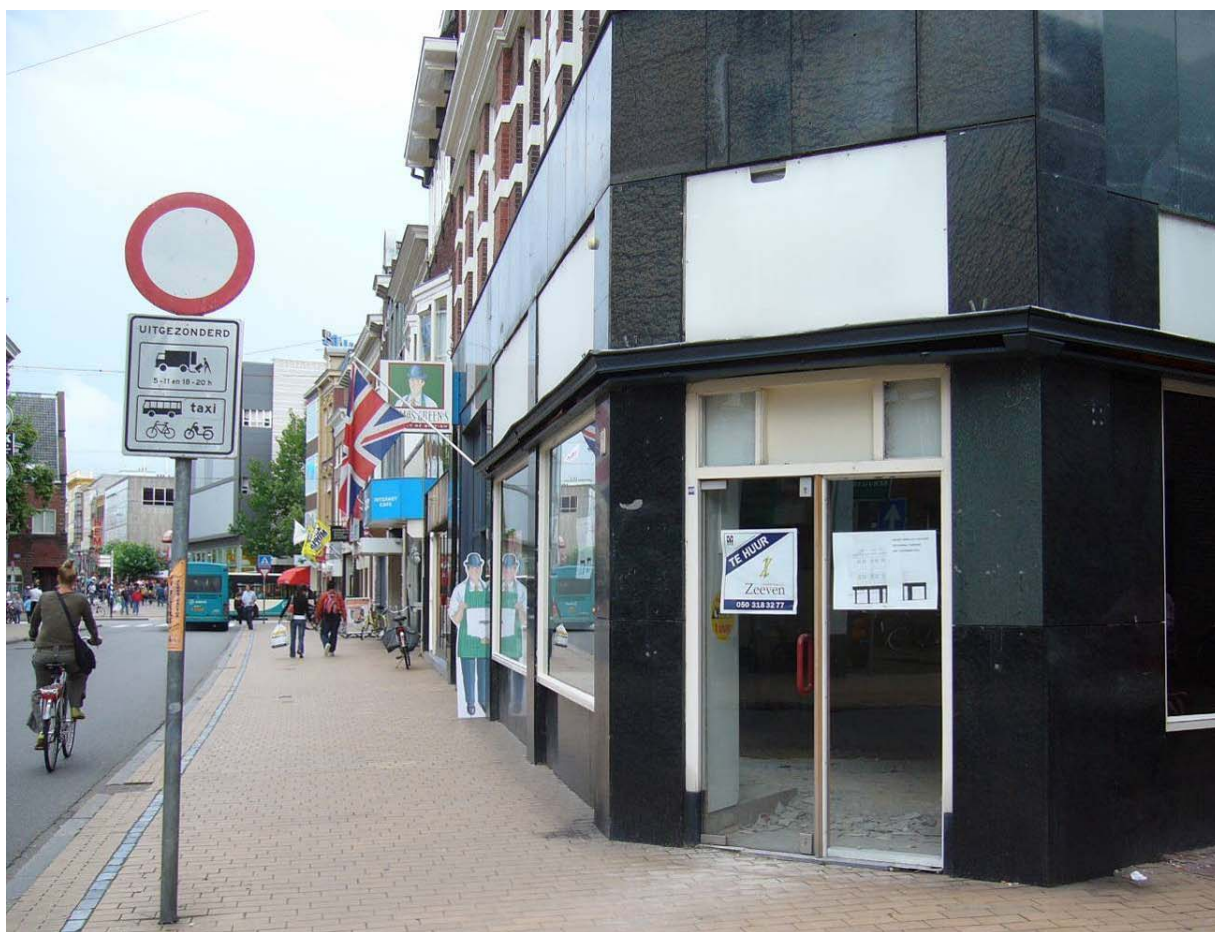
Afbeelding 29: de Herestraat: A: verkeersbord van het VCP, OV en fiets wel toegestaan, B: de straat is heringericht met o.a. gele steentjes en C: er staan in deze straat enkele winkelpanden leeg

Het VCP was een uitvoering van de ideeën van de Doelstellingen Nota voor de binnenstad (1972). Een andere doelstelling was het behoud van de kleinschalige bebouwingsstructuur. Voor de detailhandel betekende dit een beperking in het aantal uitbreidingsmogelijkheden. Dit beleid zal er zeker voor gezorgd hebben dat een aantal winkels met volumineuze goederen (o.a. meubelzaken) naar PDV-locaties, zoals Meubelboulevard Peizerweg en Hoendiep, zijn vertrokken. Dit heeft zijn weerslag gehad op de detailhandel in het onderzochte gebied.