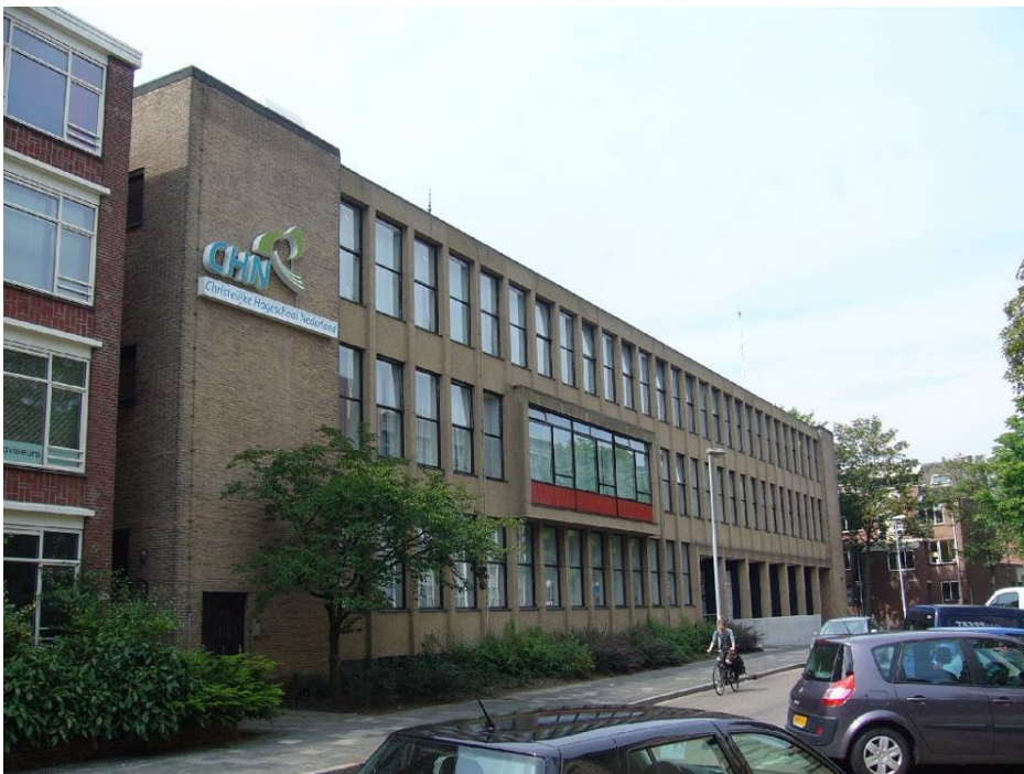
Afbeelding 35: de CHN in een voormalig kantoorpand

Het hoger onderwijs laat een tegengestelde beweging als die van het lager onderwijs zien. Zowel in 1900 als in 1961 zijn er geen scholen voor dit onderwijs in het onderzochte gebied te vinden. Misschien dat de Rijksuniversiteit Groningen een enkel pand in gebruik had in 1961. Het jaar 2005 laat een heel ander beeld zien: op maar liefst zes locaties zijn instellingen voor middelbaar en hoger onderwijs gevestigd. De Hanzehogeschool (HBO) is er vertegenwoordigd met de Kunstacademie Minerva aan het Gedempt Zuiderdiep en het Conservatorium aan de Radesingel/Radebinnensingel. De Academie van Bouwkunst, aan de Zuiderkuipen, is onderdeel van een Rotterdamse HBO-instelling. De Christelijke Hogeschool Nederland (ook HBO) heeft de Lerarenopleiding Basisonderwijs aan de Phebenstraat en HBO Nederland heeft een vestiging in de Ubbo Emmiusstraat. Tot slot heeft de Rijksuniversiteit Groningen een vestiging aan de Radesingel (hoek Winschoterkade), alhoewel hier geen gewoon onderwijs wordt verzorgd, het wordt gebruikt als hotel, opleidings- en congrescentrum.