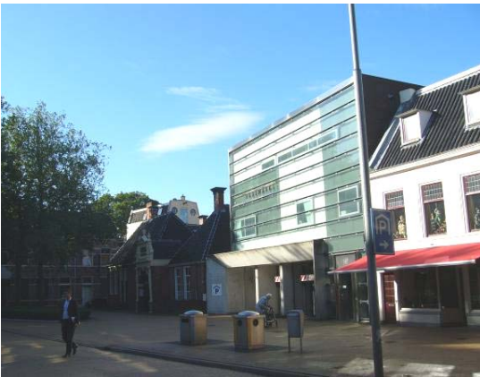
Afbeelding 28: parkeergarage Rademarkt

Naast het VCP werd het parkeren in parkeergarages gestimuleerd, daarom zijn uiteindelijk een flink aantal parkeergarages gebouwd. In het onderzochte gebied was in 1977 net een parkeergarage gereedgekomen, die aan de Herepoortenmolendrift. Later zijn de parkeergarages bij bioscoop aan het Gedempt Zuiderdiep