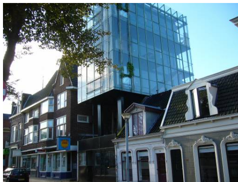
Afbeelding 34: antiekwinkels en moderne cultuur aan het Gedempt Zuiderdiep